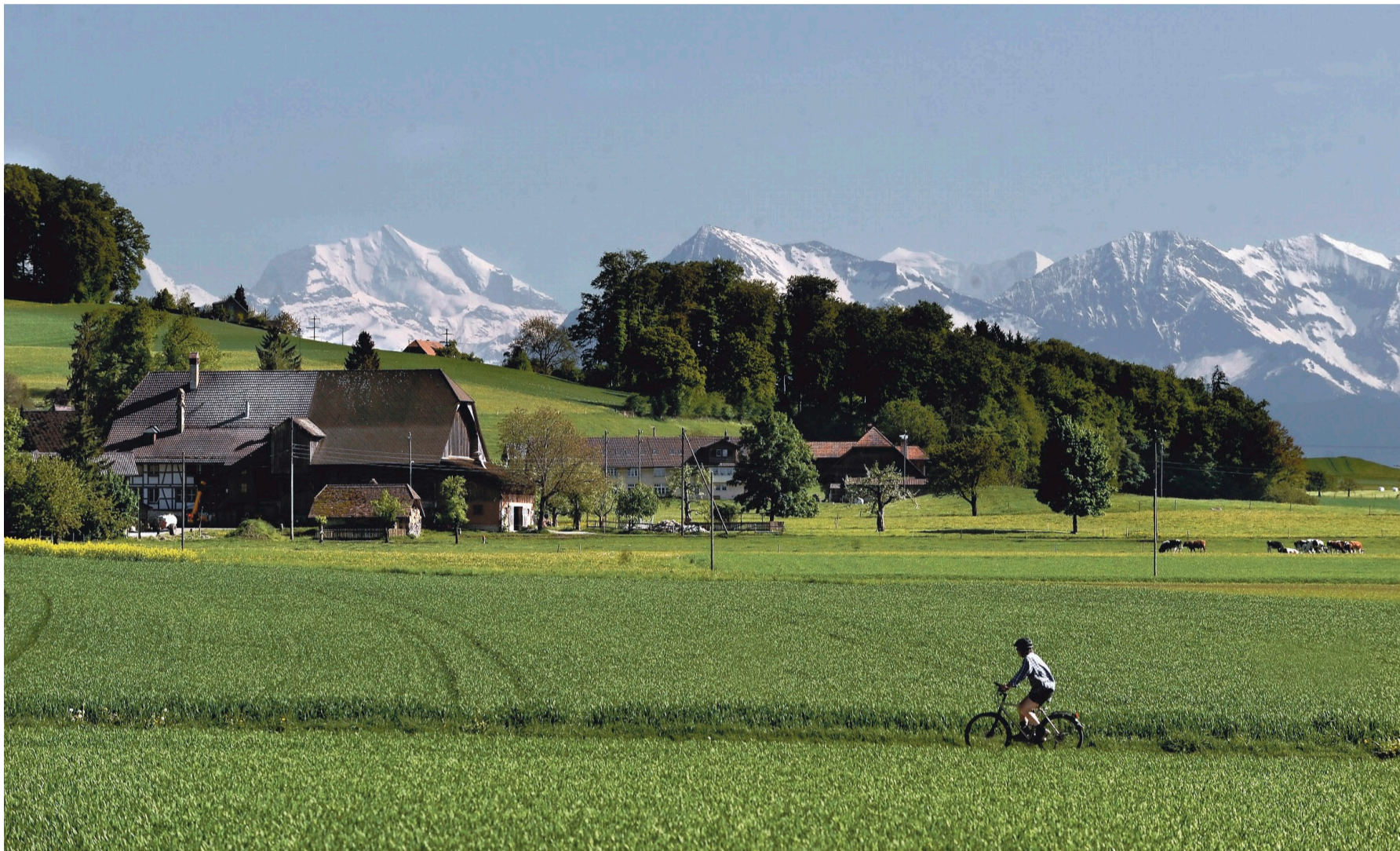
Eine Fusion, die geglückt ist: Trimstein hat im Juni die Fusion mit Münsingen beschlossen.

Eine ideale Grösse gibt es nicht. Aber es gibt Strukturen, die zweckmässiger sind als andere. Im Kanton Bern jedoch wurden die Strukturen nie umfassend hinterfragt, gerade auch in den Randregionen. Die Leute, welche die Gemeindeautonomie über alles stellen, sollten einfach bedenken, dass Kleinstgemeinden nicht gleichbedeutend sind mit mehr Demokratie. Im Kanton Uri zum Beispiel, wo ich die Gebietsreform untersucht habe, funktionieren die Gemeinderäte in einzelnen Gemeinden nur noch als Clearingzentralen. Aufgaben, die sie alleine erfüllen, gibt es kaum noch. Und bei jenen, die geblieben sind, stossen sie an Grenzen. Die Baugesuche etwa würden zum Teil ganz schlecht be-